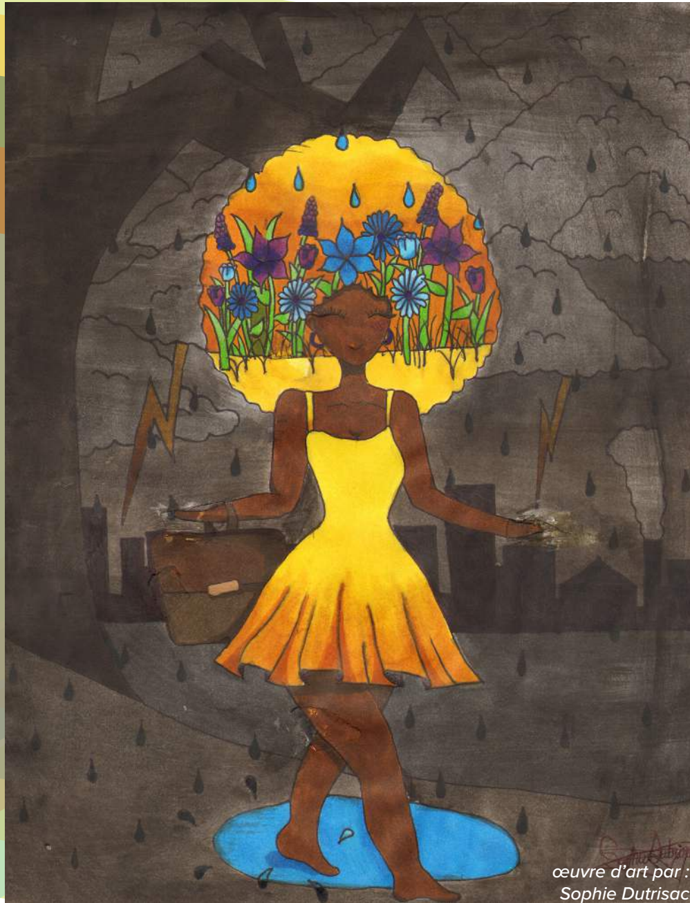
œuvre d'art par : Sophie Dutrisac

INAUGURATION D'UNE NOUVELLE ÈRE DE SOUTIEN EN SANTÉ MENTALE